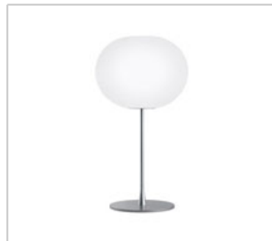
Glo-Ball T2 design by Jasper Morrison