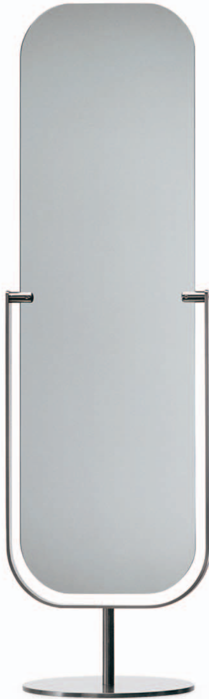
MIRROR Jasper Morrison 1997