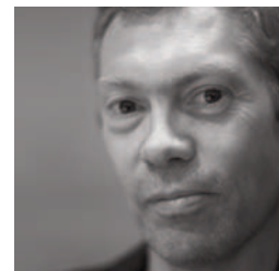
by L. Gulbring

Geboren 1959 in London, Universitätsabschluss am Royal College of Art, 1986 Eröffnung seines ersten Studios. Unmittelbar danach beginnt eine lange und interessante Zusammenarbeit, die ihn mit Cappellini verbindet; heute arbeitet er zwischen London und Paris für wichtige Firmen wie Alessi, Flos, Rowenta, Sony und Samsung. Jedes seiner Projekte weist eine minimalistische Eleganz auf, die ihm extreme Modernität verleiht, obwohl es sich um eine Art essentielle, mit der Vergangenheit verbundene Urform handelt, und die Funktion der Ausdruckskraft stets vorangestellt wird.